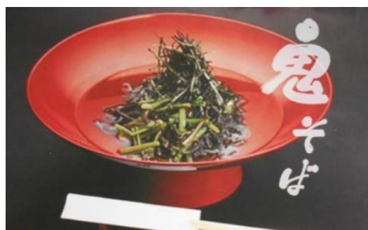
【大江山食堂の鬼そば】